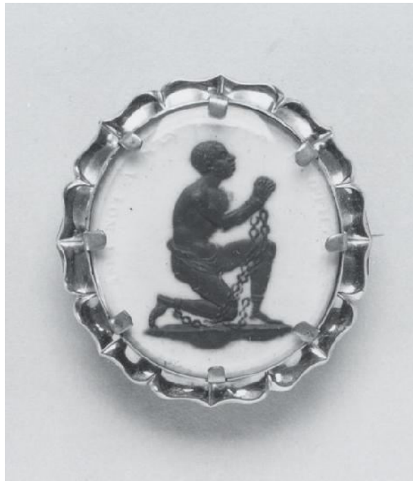
Logo der britischen Abolitionisten auf einem Medaillon aus der Porzellanmanufaktur von Josiah Wedgwood

http://commons.wikimedia.org/wiki/File:Wedgwood_-_Anti-Slavery_Medallion_-_Walters_482597.jpg